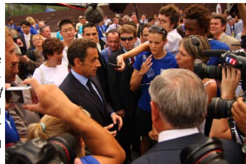
Nicolas Sarkozy à la rencontre des athlètes

Au cours d'une allocution, prononcée dans un climat très convivial, le chef de l'Etat a exhorté les athlètes à « tout donner et surtout à « être heureux », rappelant que bien des sportifs français auraient aimé être à leur place. « Soyez vous même, ayez confiance ! Tout un pays est derrière vous », tels ont été ses derniers mots, en guise d'encouragements. Le Président de la République a enfin entamé un dialogue spontané avec de nombreux sportifs, tels Teddy Riner ou Laure Manaudou (photo) avant de quitter le village pour un entretien de travail avec Hu Jintao.