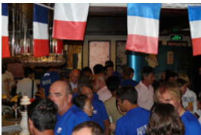
Le Club France de Qingdao

La cérémonie vécue à Pékin à Qingdao et Hong Kong