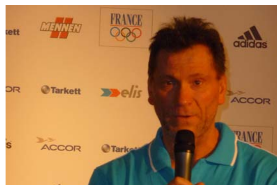
Olivier Krumboltz—entraîneur de l'équipe de France de Handball féminin

« L'équipe est composée de 6 filles et 7 garçons. Lors des dernières compétitions, la plupart sont montés sur les podiums ou ont disputé les finales mondiales. L'objectif est de une à deux médailles, avec 5 potentiels réels qui peuvent aussi gagner une médaille. »