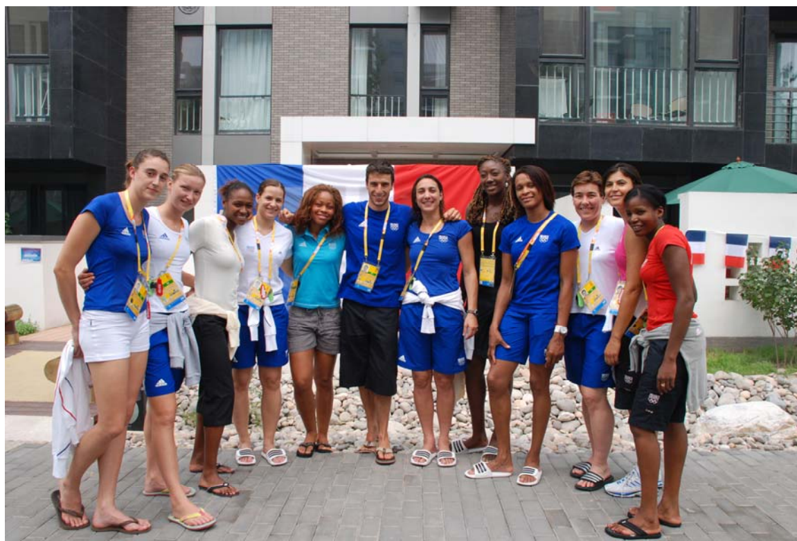
Tony Estanguet entouré par l'équipe de France féminine de handball devant le bâtiment France du village