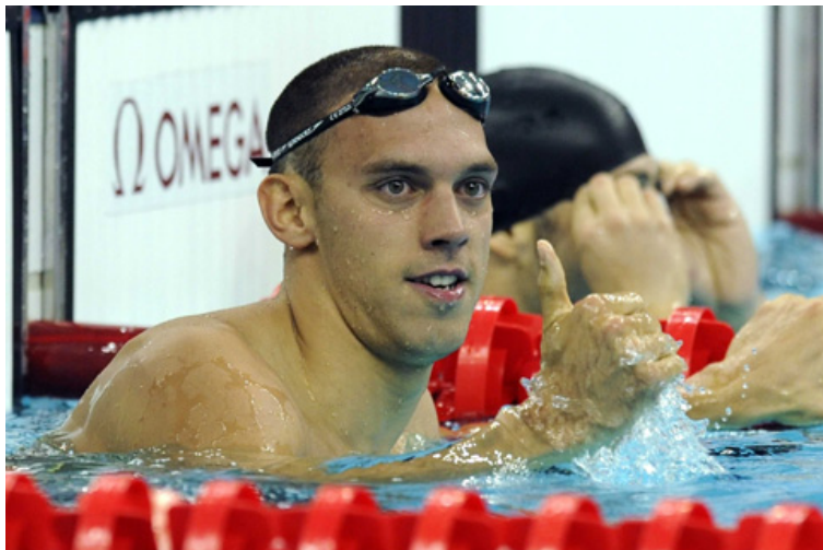
Hugues Dubosq, nouveau record de France au 100m brasse en 59'67